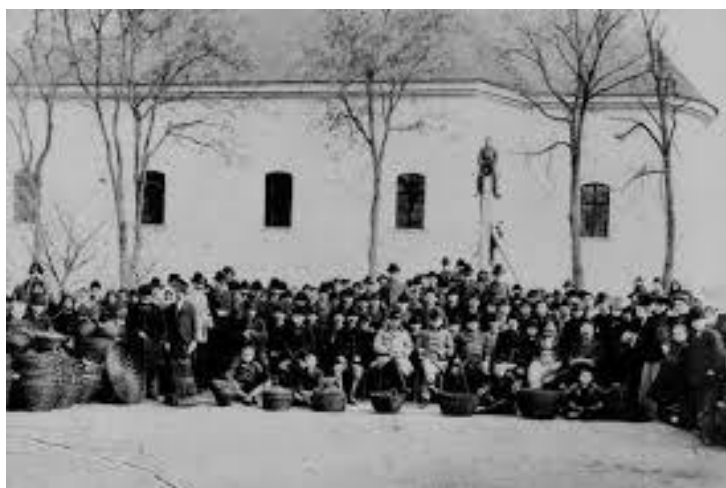
1903. Csanádpalotai kaskötő tanfolyam résztvevői,