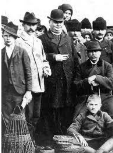
Az előbbi kép kinagyítva.